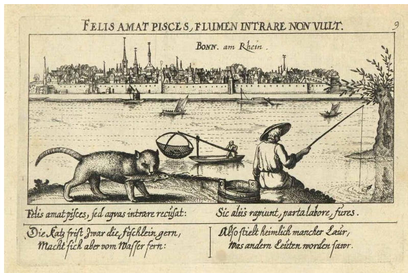
Kupferstich mit einer Stadtansicht von Bonn von der Beueler Seite aus gesehen (16./17. Jhr.)