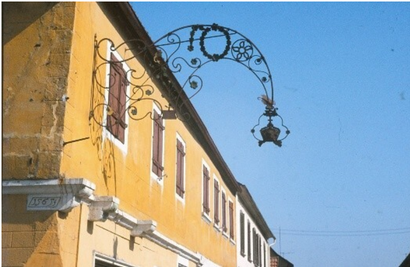
Haus von Eickhard Weißbrod in Billigheim (ca. 1980)