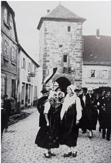
Obertor (um 1935)