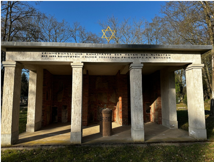
Frontansicht des Lapidariums auf dem Neuen jüdischen Friedhof Bocklemünd (2026). Die Widmung im Giebel der Säulenhalle lautet: Erinnerung- und Ruhestätte der Toten des ältesten bis 1695 genutzten Kölner jüdischen Friedhofs am Bonntor.