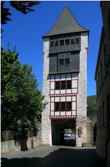
Torturm Münzturm in Bacharach, von der Stadt aus gesehen (2017)