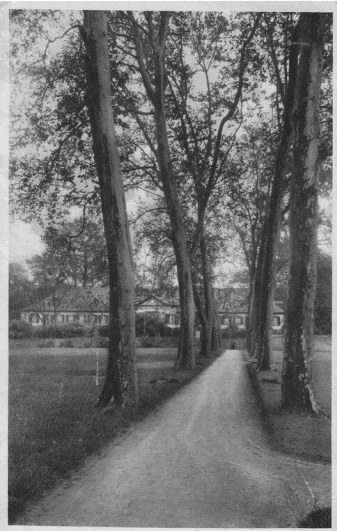
Vom Rhein aus führte eine Platanenallee hoch durch den Park zum Mendelssohn-Palais (1920)