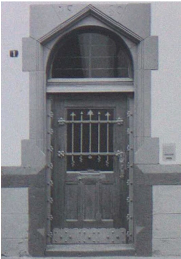
Portal zum Weinkellereigebäude Fleischstraße 1 in Bacharach (1970er Jahre)