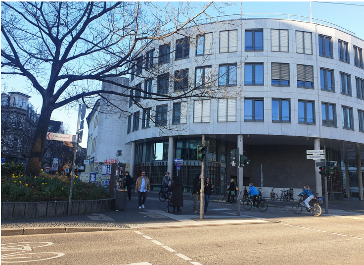
Elisabeth-Selbert-Platz in Bonn (2026)