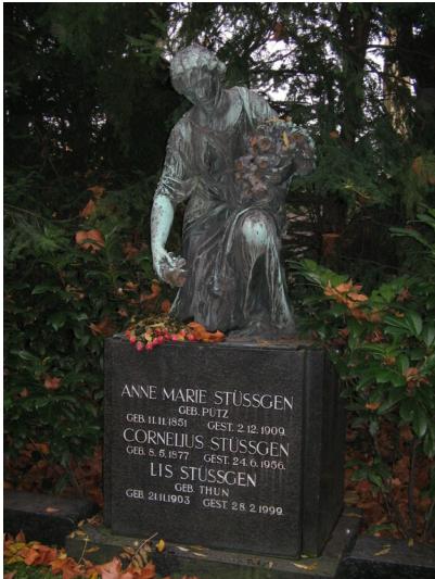
Das Grabmal der Familie Stüssgen auf dem Kölner Friedhof Melaten, Flur 60 (2006). Auf Cornelius Stüssgen geht 1897 die "Kölner Konsumanstalt" zurück, Vorläuferin der späteren Supermarktkette Cornelius Stüssgen AG.