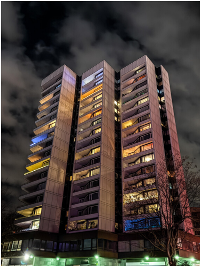
Abendliche Ansicht des 1959/60 erbauten, 57 Meter hohen Bull-Hochhauses am Wiener Platz in Köln-Mülheim aus südöstlicher Richtung (2025).