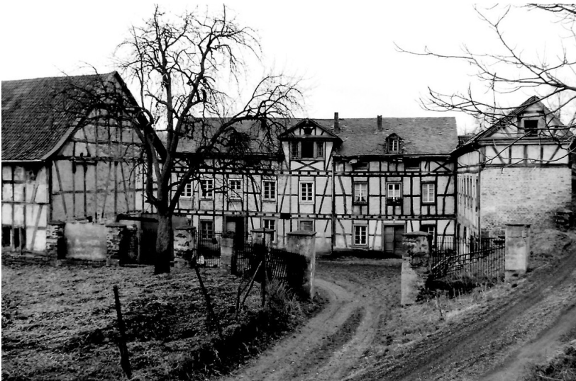
Die van-Hees'sche Mühle in Sinzig ca. 1950