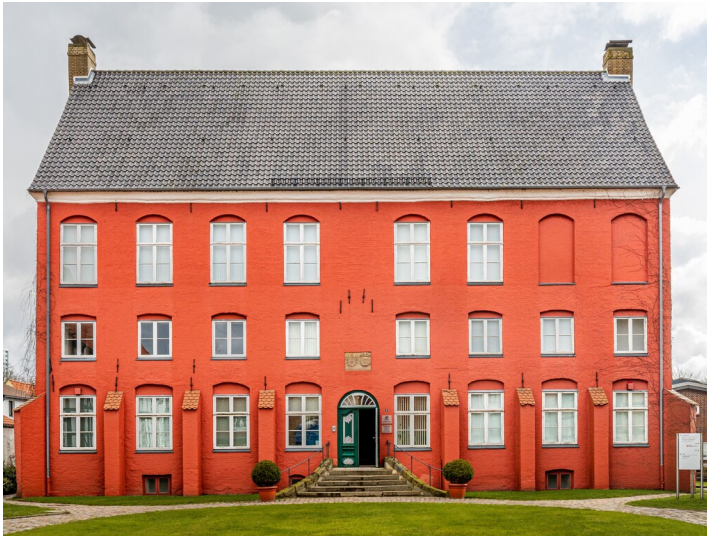
Stadtmuseum Schleswig, Günderothscher Hof, Hauptgebäude (2021)