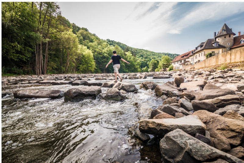
Alte Welt