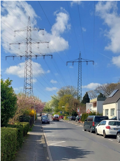
Blick über den Mühlenweg in Leverkusen-Küppersteg (2026), zwischen 1897 und 1924 produzierte etwa hier eine Fabrik "Schmitt & Co." Zündhütchen und Sprengkapseln.