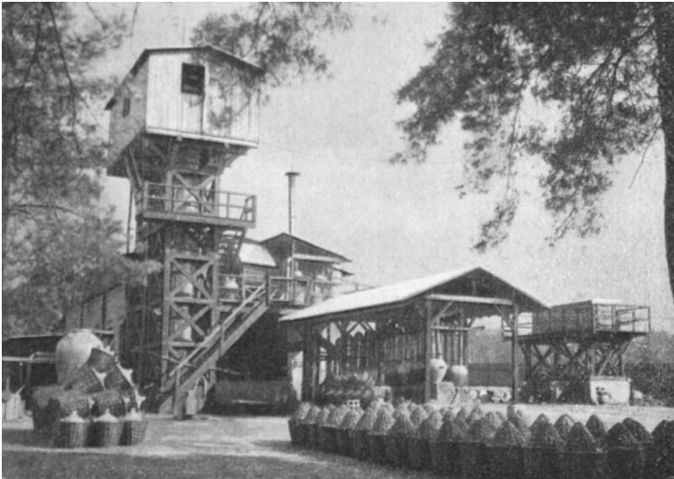
Anlage zur Denitrierung auf dem Gelände der Sprengstoff AG Carbonit in Schlebusch (um 1900).