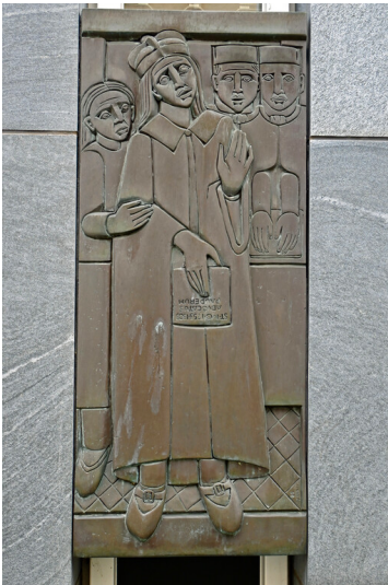
Relief des heiligen Ivo in Solingen (2025)