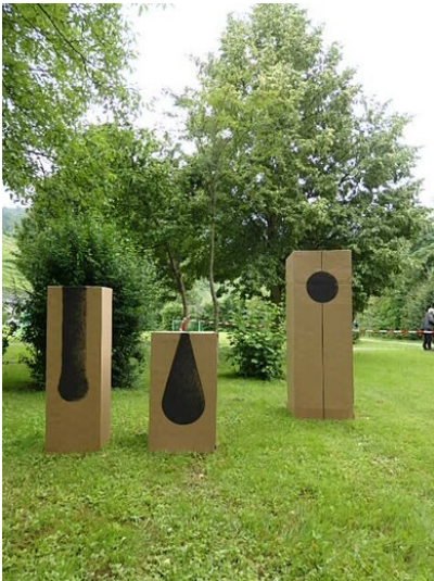
„Summ- + Klangsteine“