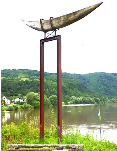
"Ein Denkmal für ein Schiff"