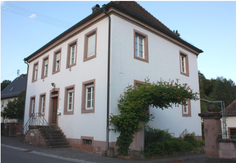
Ehemaliges Pfarrhaus in Niederschlettenbach (2026)