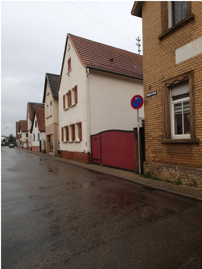
Hauptstraße / Ecke Bahnhofstraße in Zeiskam (2026)