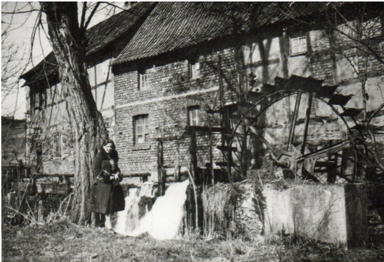
Bodendorfer Mühle um 1930