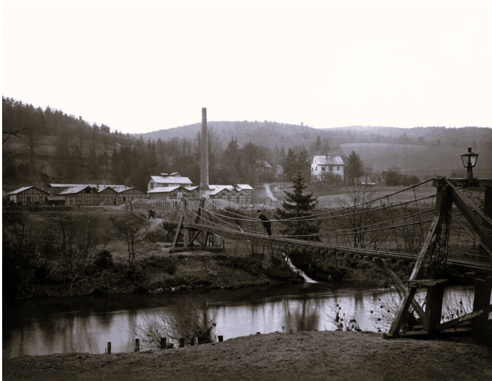
Die sogenannte "Schwungbrücke" über die Agger zum Gelände der Grube Castor (um 1895).