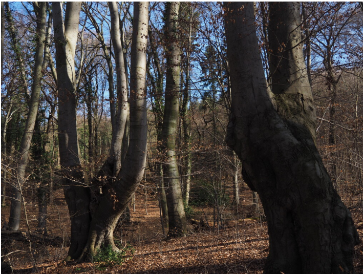
Rahmbuchen an der Oberdollendorfer Hardt (2024).