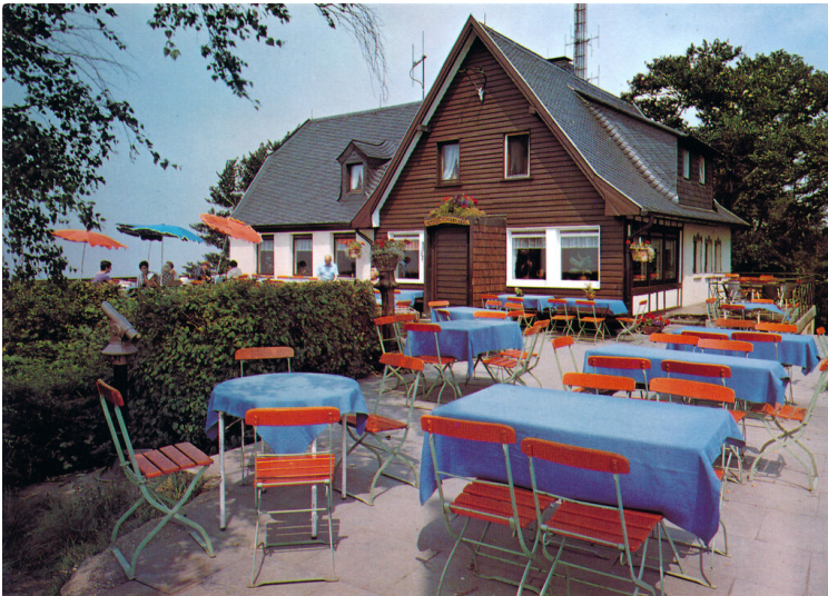
Gaststätte auf dem Ölberg. Postkarte (um 1975).