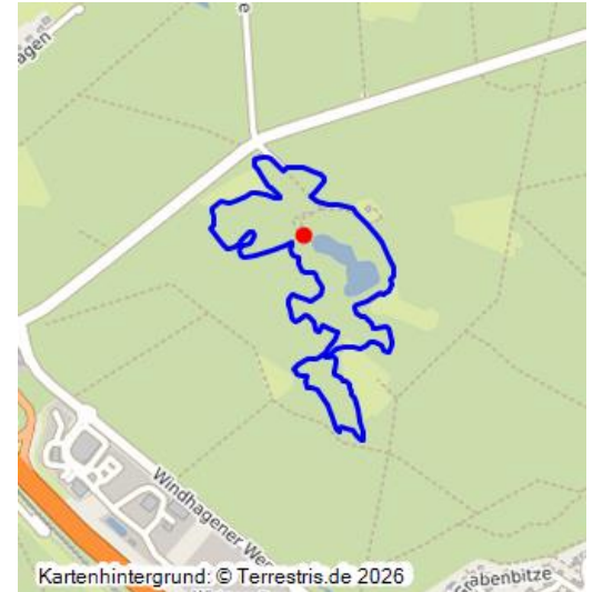
Lageplan zum Konzessionsgesuch der Basaltgewerkschaft Honnef für einen dampfbetriebenen Steinbrecher am Dachsberg (1911). ARSL-LSK 1034.