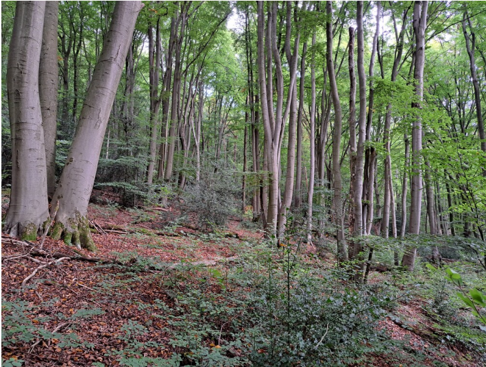
Rahmbusch im Tretschbachtal bei Rhöndorf (2024).