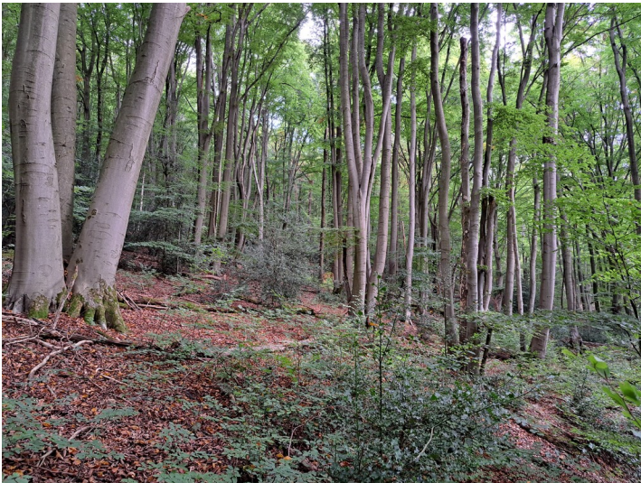
Rahmbusch im Tretschbachtal bei Rhöndorf (2024).