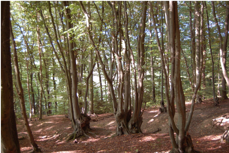
Hainbuchen Niederwald bei Bad Honnef-Selhof (2005).