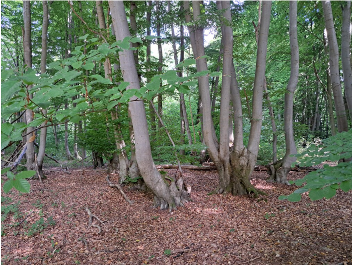
Rahmbuchen am Paffelsberg bei Oberkassel (2025).