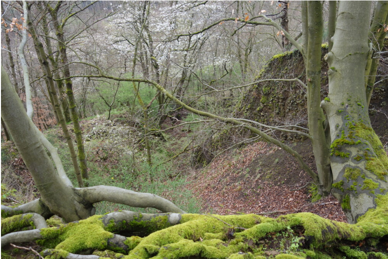
Steinbruch am Schellkopf, (2024).