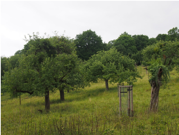
Streuobstwiese des Wintermühlenhofs (2017).