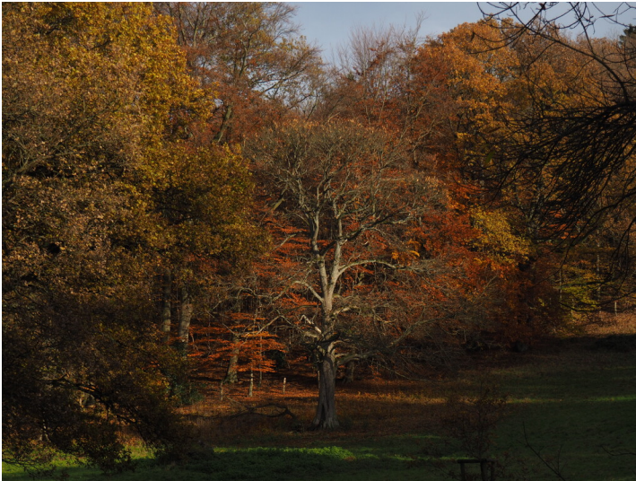
Die Userothswiese, eine alte Hutung (2019).