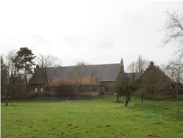
Garten- und Parkanlage des Gutes Friedrichsruh in Kessenich (2014)