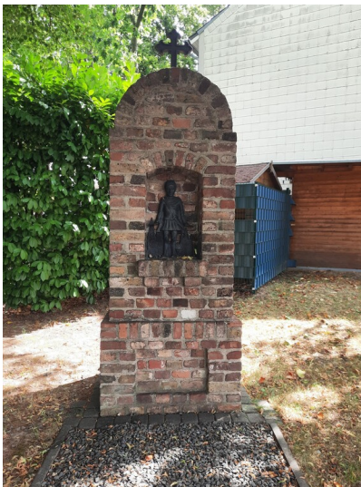
Bildstock St. Florian (2025)