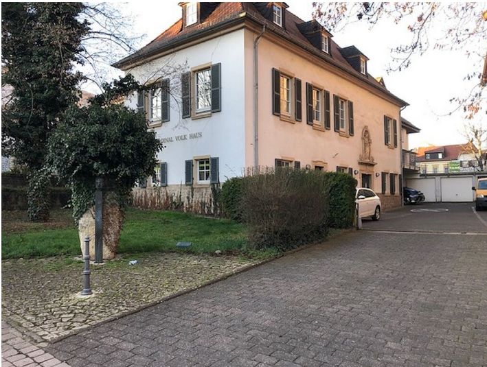
Das Kardinal-Volk-Haus in Alzey (2025)