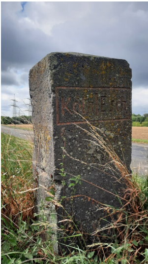
Grenzstein an der Roggendorf-Thenhovener Straße mit Blickrichtung Köln-Esch (2025)