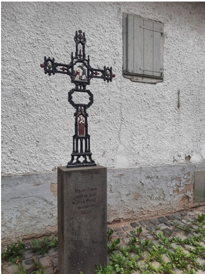
Schmiedeeisernes Kreuz in Esch (2025)