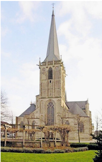
Frontansicht des Willibrordi-Doms in Wesel (2005).