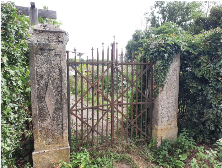
Alte Einfriedung des Gartens des Frohnhofs (2025)