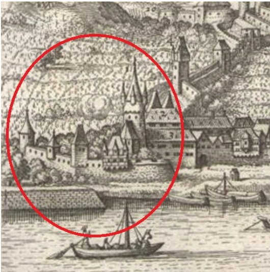
Zollbastion in Bacharach in der historischen Stadtansicht von Matthäus Merian aus dem Jahre 1645 Fotograf/Urheber: Matthäus Merian