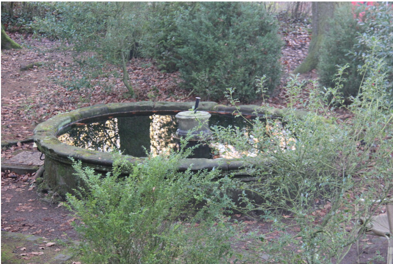
Brunnen im Klostergarten des Klosters Steinfeld (2025).