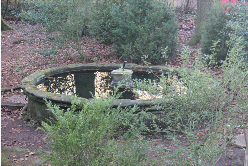
Brunnen im Klostergarten des Klosters Steinfeld (2025).