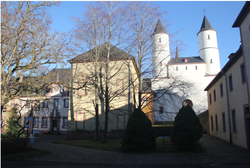
Basilika im Kloster Steinfeld in Kall (2025).