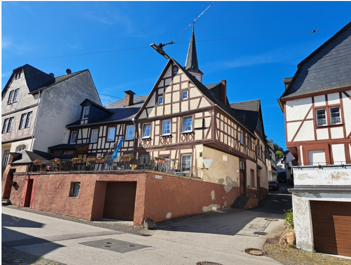
Fachwerkhaus Hauptstraße 89 in Briedel (2025)