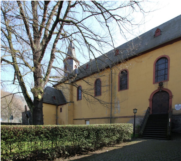
Die Katholische Pfarrkirche in der Langstraße 2 in Bacharach (2014)