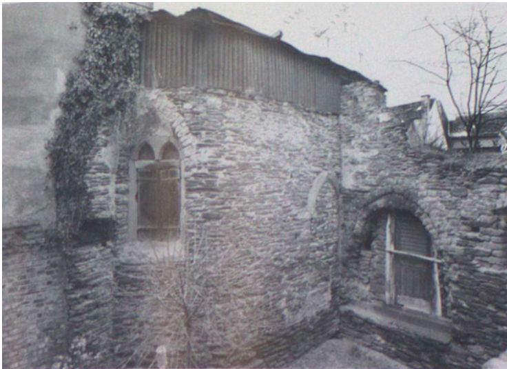
Heilig-Geist-Kapelle im ehemaligen Hospital in Bacharach von Nordosten (um 1960).