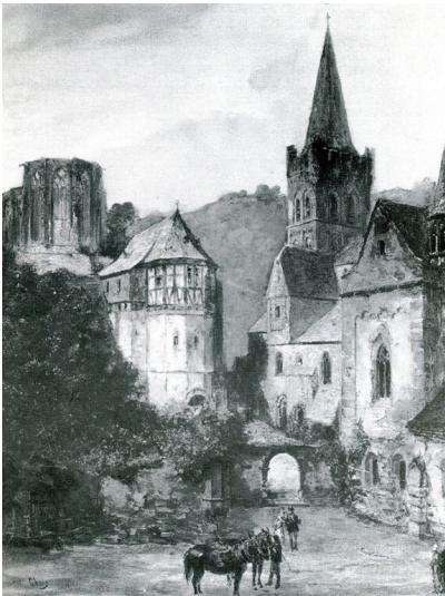
Zeichnung der St. Michaelskapelle von Wilhelm Ohaus (um 1860) Fotograf/Urheber: Wilhelm Ohaus