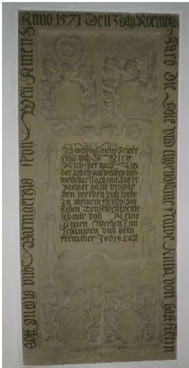
Epitaph von Anna von Hattstetten in der Pfarrkirche Herxheim (2024)