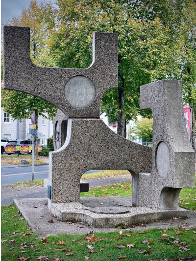
Gouda-Plastik in Solingen-Höhscheid (2025)