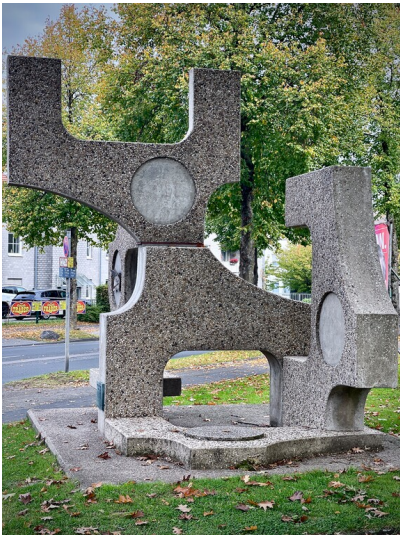
Gouda-Plastik in Solingen-Höhscheid (2025)