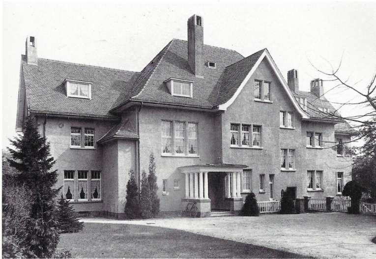
Historische Aufnahme von 1909 mit Blick auf die Nordseite der als Wohnsitz der Warenhaus-Unternehmerfamilie Tietz erbauten Villa Tietz in Köln-Marienburg (Abb. aus W. Hagspiel, Marienburg, Köln 1996, Band I, S. 597). Fotograf/Urheber: unbekannt